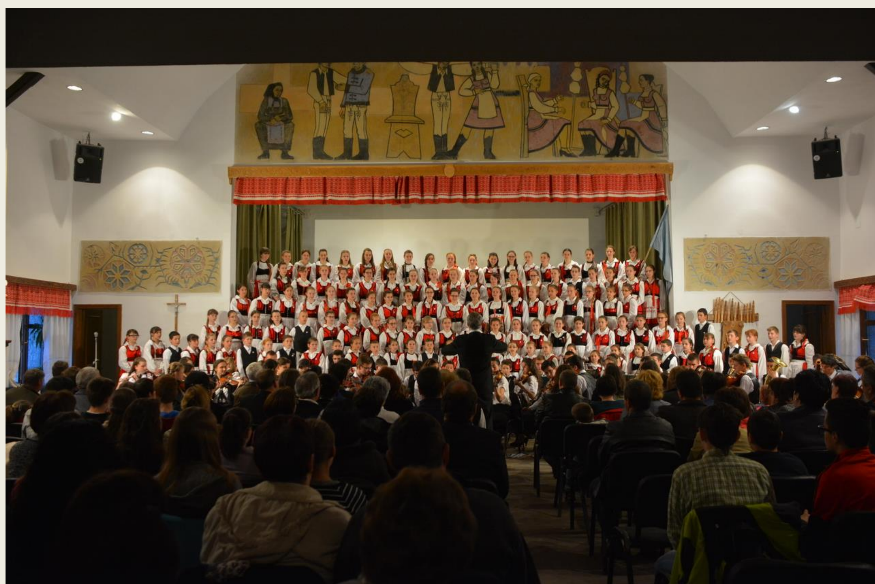
Filinapok 2016.05.07, Szentegyháza