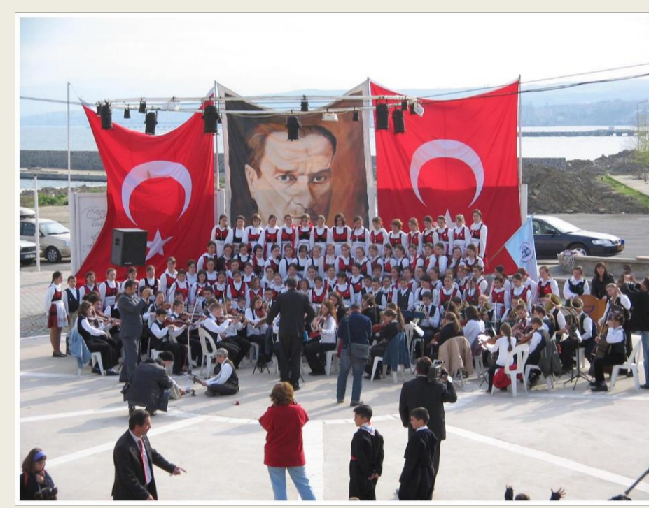
Törökországi fellépés, 2005 május