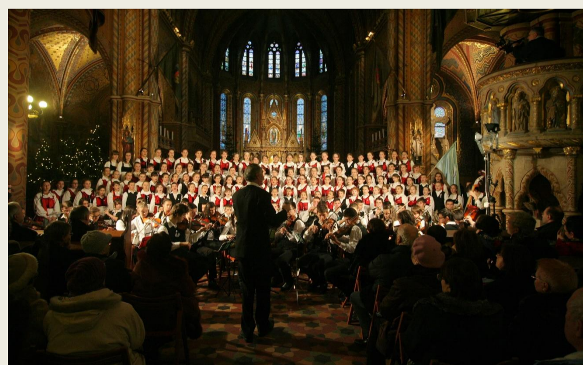
Mátyás-templom 2013.12.20. Budapest

Repertoárjuk az akkori kötelező munkás dalok mellett tartalmazta a zeneirodalom legszebb gyöngyszemeit, mint a Mozart „Béke dal”, Brahms „Bölcsődal” és természetesen a magyar identitást magába hordozó Kodály népdalfeldolgozásokat.