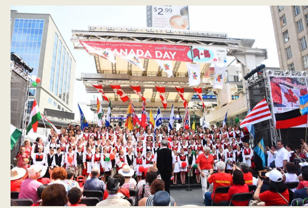
Nyári turné 2017. 07. 01. - Toronto