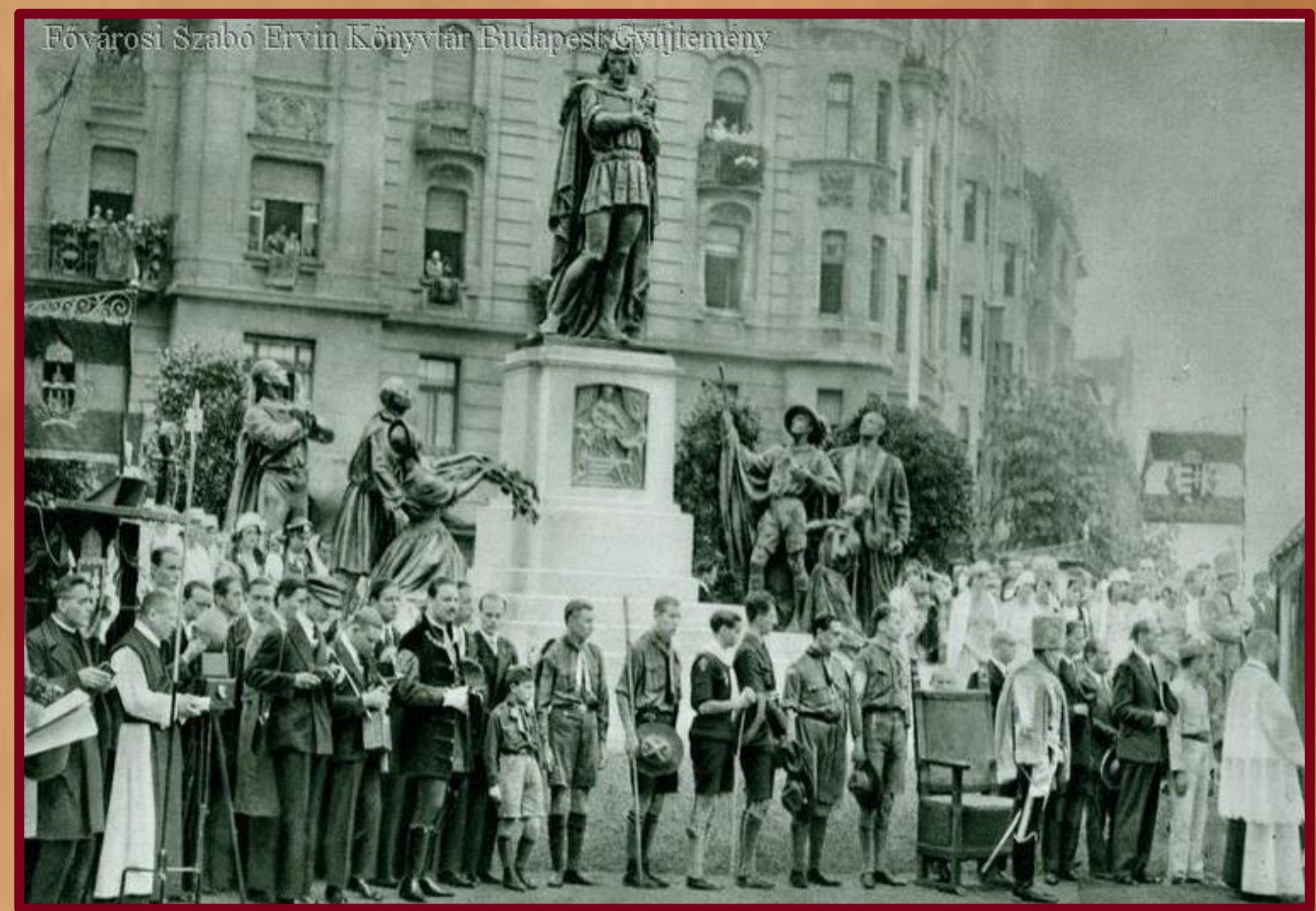
Külföldi cserkészek s a magyar ifjúság képviselői a Szent Imre-szobor előtt

Az állam szempontjából mindegyik emlékév egyforma fontossággal bírt, de Szent István ünnepe ennél is többet jelentett. Az államalapító király képét az ország vezetői az aktuális politikai döntéseik alátámasztásaként kívánták használni – a magyar állam újjáépítésére.