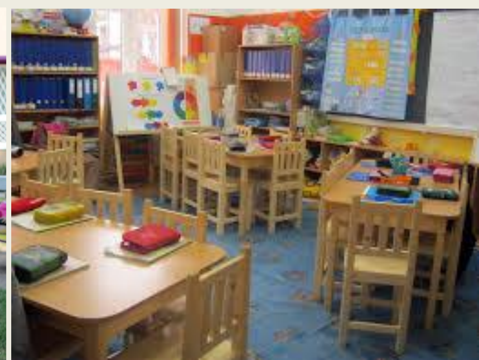
Saját forrás: Nagyvárdi Lépésről lépésre programmal működő óvoda és iskola