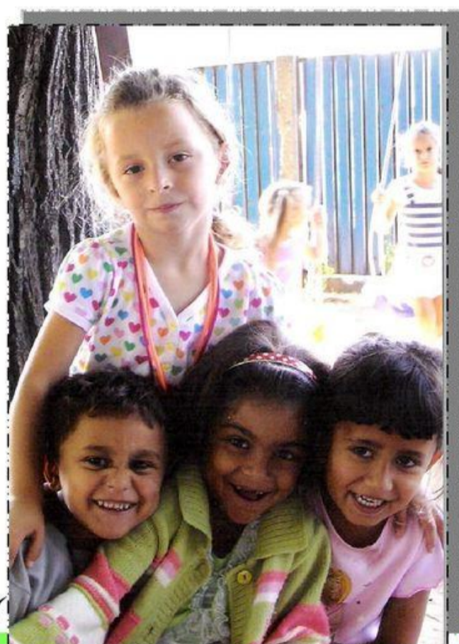
A Debreceni Pósa Utcai Óvoda Pedagógiai Programja Forrás: http://docplayer.hu/1952489-A-posa-utcai-ovoda-pedagogiai-programja.html

Jó szívvel és felelősséggel ajánljuk azoknak az óvodapedagógusoknak és szülőknek, akik bíznak a gyermekek önálló fejlődésében, a személyiség kibontakozásában, de azt vallják, hogy mindehhez szükséges az elhivatott, a gyermekek tiszteletét, értő és ismerő óvodapedagógus tudatos hatása, a nevelés.