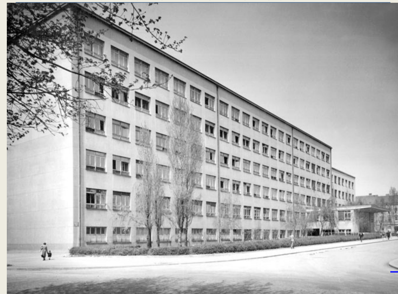
Műszaki Kar, Zágráb, 1950 k.

https://tehnika.lzmk.hr/tehnicki-fakultet-u-zagrebu