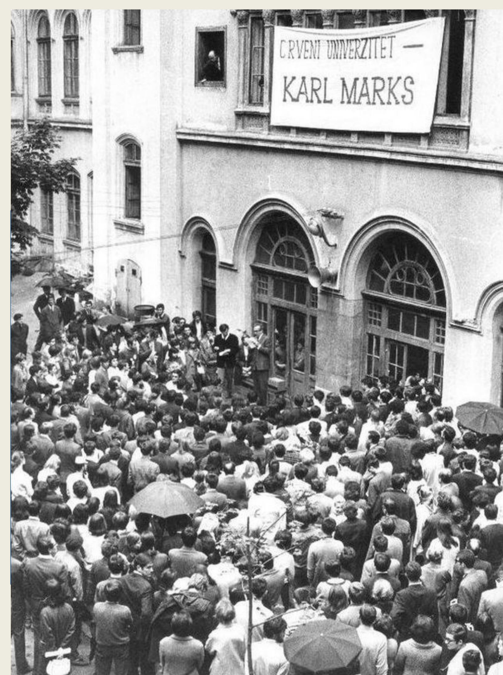
Belgrádi Egyetem, 1968. június

eu.boell.org/sites/default/files/1968_revisited.pdf