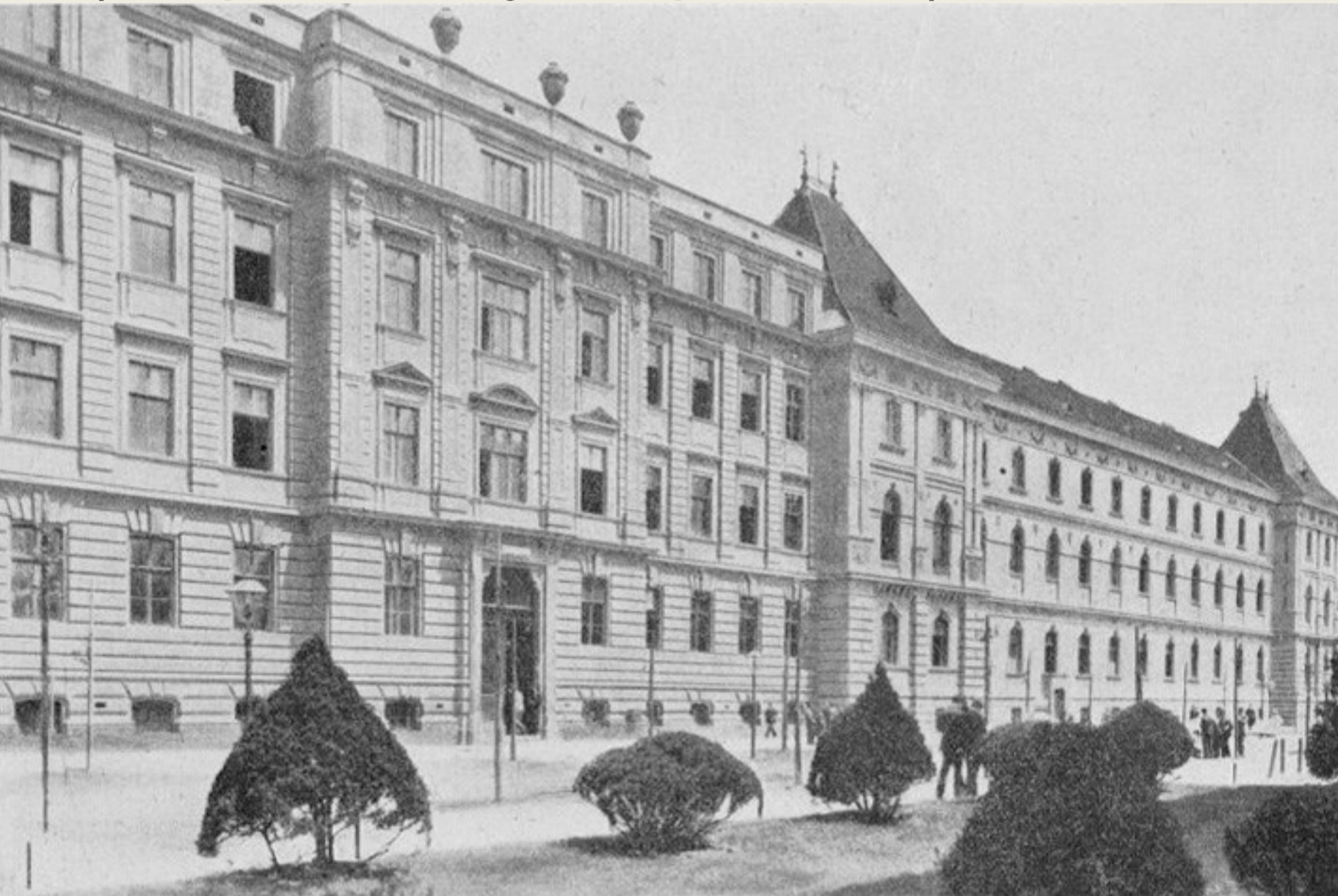
Rektori Hivatal, Zágráb

https://tehnika.lzmk.hr/tehnicki-fakultet-u-zagrebu/