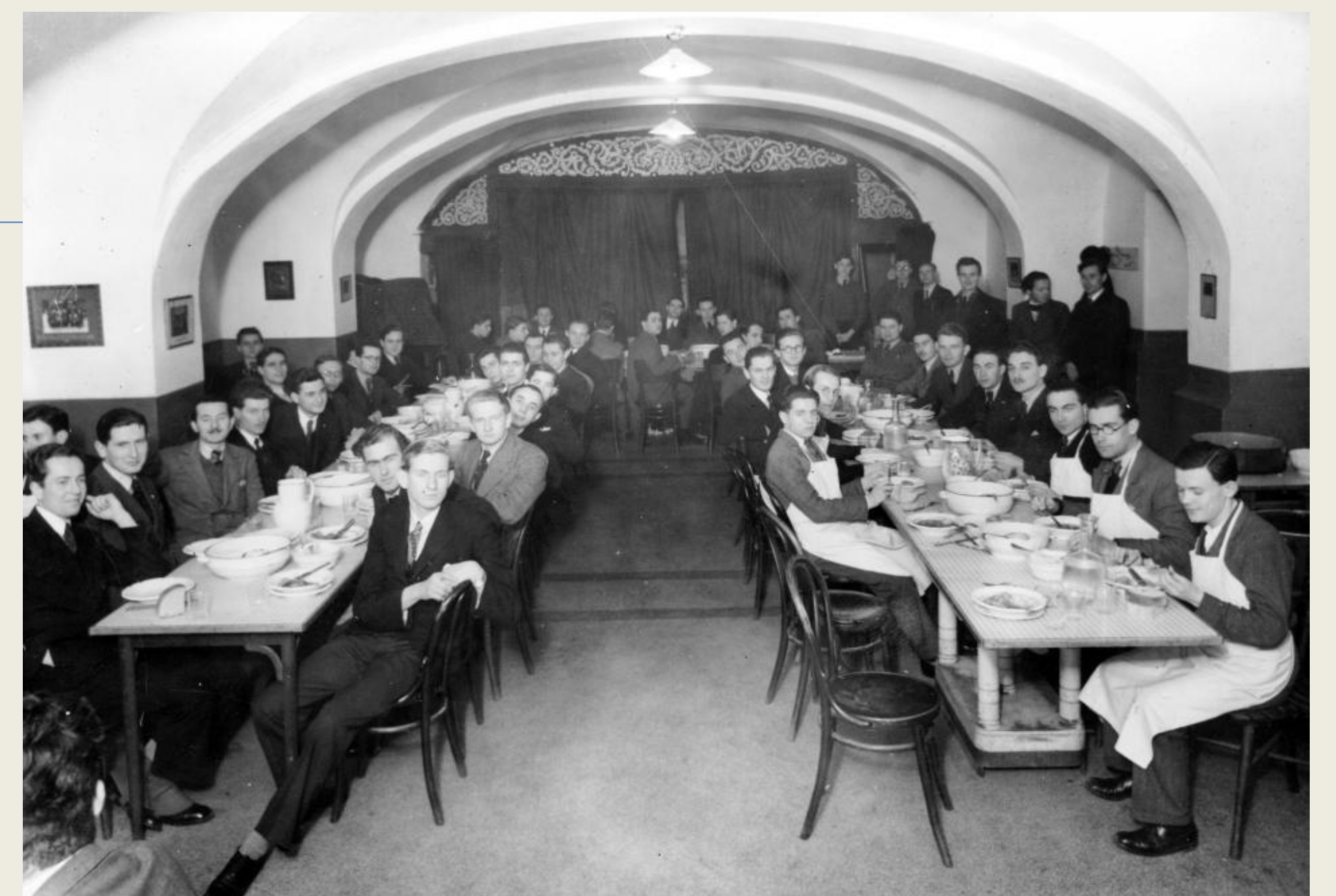
6. ábra: Foderatio Americana Adalbertinum menzája, 1940/Mészöly Leonóra, fortepan, 10828.