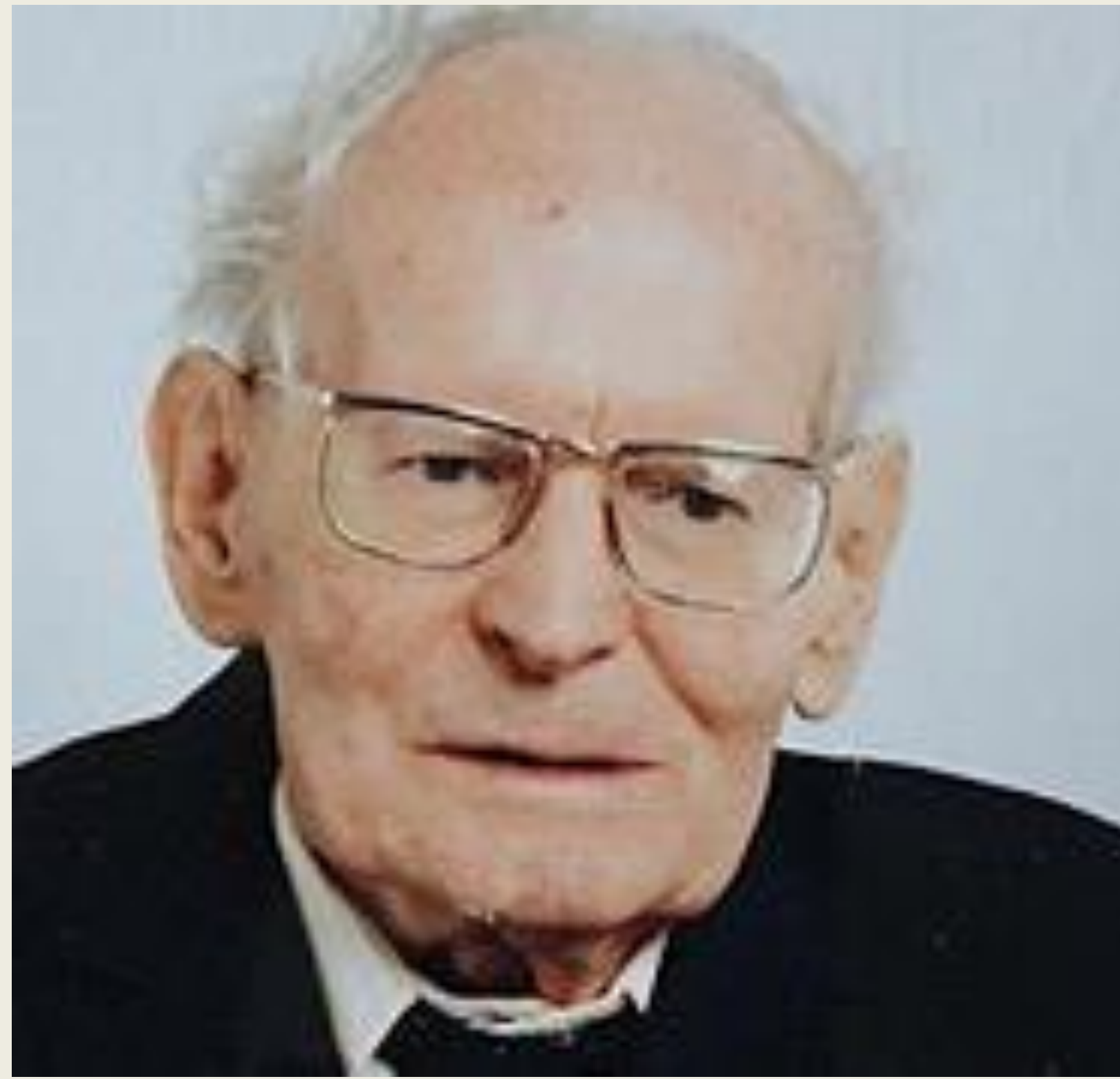
1. ábra: Mátyás Antal

Mátyás Antal 1941-ben iratkozott be a József Nádor Műszaki és Gazdaságtudományi Egyetemre. Elvégzett három évfolyamot, majd a hetedik félév néhány vizsgáját is letette (az utolsót már a Szálasi-kormány idején, 1944 novemberében, professzora fűtetlen lakásán). Rövid katonaságát 40 hónapos hadifogság követte, ahonnan hazatérve, immár az akkor szervezett Magyar Közgazdaságtudományi Egyetemen fejezte be tanulmányait (SZENTGYÖRGYI, 2002).