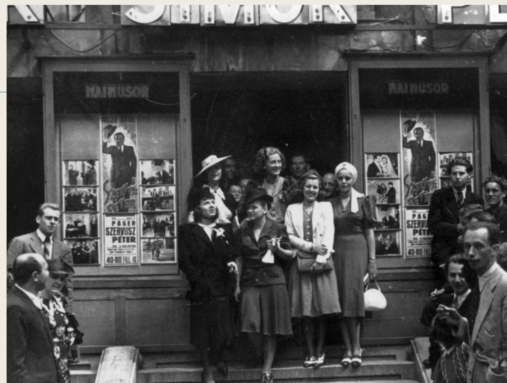
5. ábra: Corvin mozi, 1940/fortepan,18347.