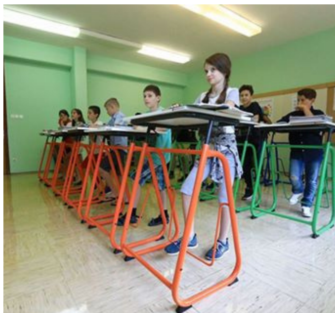
KINÉSZTETIKAI ASZTAL.

Egy korábbi kutatásban (Mrázik, 2017) negatív tendencia körvonalait mutattuk ki a közoktatásban tanulók körében a különféle társadalom,- és oktatáspolitikai intézkedésekből és a folyton változó környezetből adódóan. Pareto-elemzéssel arra a következtetésre jutottunk, hogy a közoktatás csaknem „kiürüléséről” beszélhetünk, a megismételt vizsgálat az SNI tanulók (Vida, 2017) számának növekedéséről és a korábban mért tendenciák további fennmaradásáról tudósít.