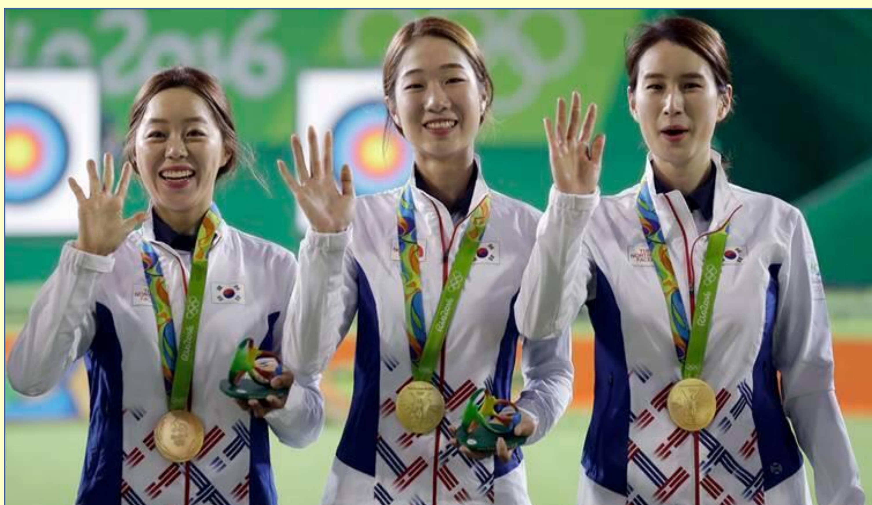
3. kép: Hyejin Chang, Choi Misun és Ki Bo Bae aranyéremet szerzett csapatban a 2016-os riói Olimpián