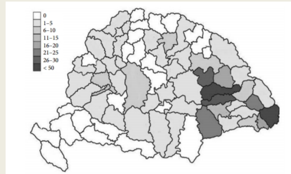
Az előfizetők területi eloszlása